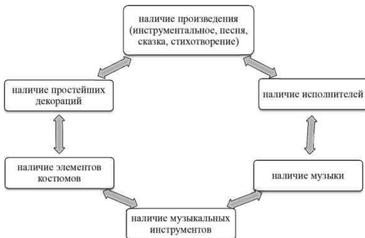
Рис. 1. Компоненты музыкальной театрализованной игры

Основными составляющими музыкальной театрализованной игры являются следующие [3] (рис.1):