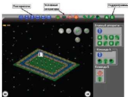
Рис. 2. Программная среда

Остальные цепочки включает задания, которые направлены на то, чтобы закрепить данные понятия (рис.2).