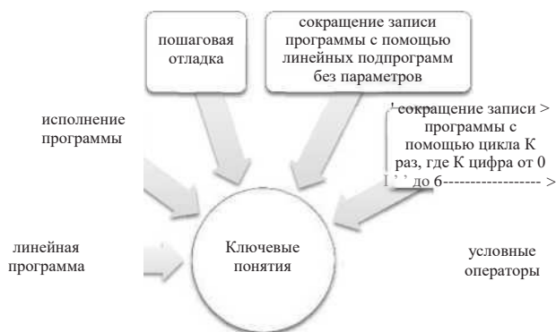
Рис. 1. Ключевые понятия ПиктоМира

ПиктоМир представляет собой обучающую программную среду, методический комплект которой включает несколько цепочек заданий. В первой цепочке осуществляется освоение правил игры ПиктоМиром и введение ключевых понятий [2]