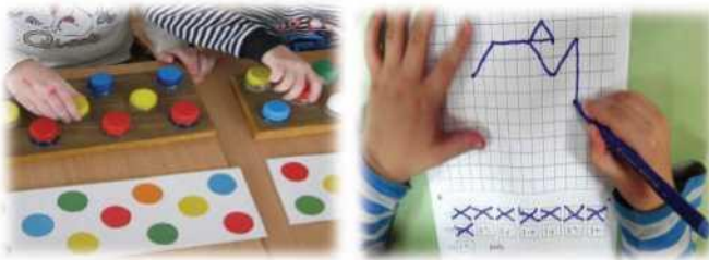
Рис.1. Игры с предметами и Графический диктант

Детям очень нравится обводить трафареты. Работа с трафаретами воспитывает усидчивость, развивает терпение и даёт первые навыки держать карандаш